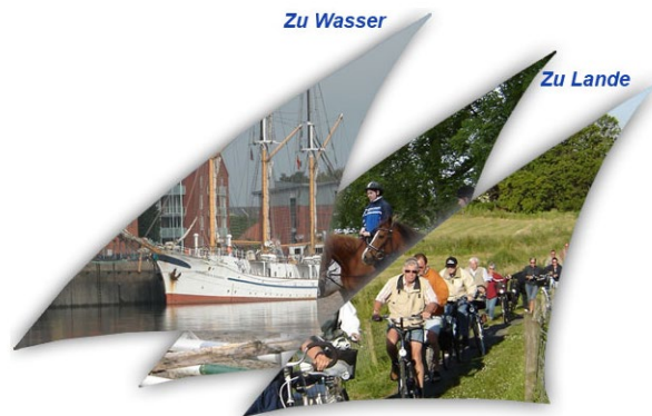
Herzlich Willkommen in Elsfleth