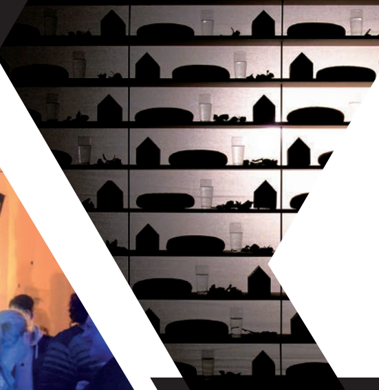
Workshop Fachbereich Architektur