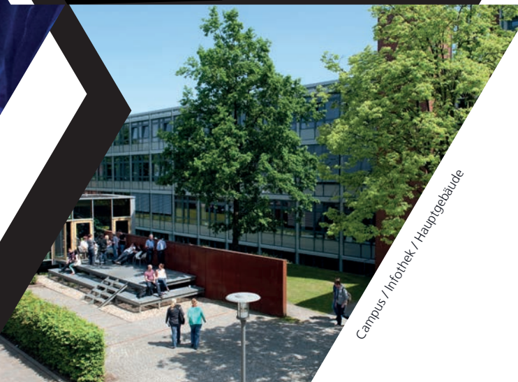
Campus / Infothek / Hauptgebäude